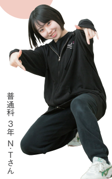
普通科 3年 N・Tさん

ダンス部は学年の壁がなく、みんな仲が良い のが魅力です。強みを活かして助け合える チームで、大会での入賞を目指しています！