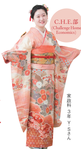
家政科 3年 Y・Sさん

着物の自装が身につく、帯結びで自分らしいア レンジを楽しめます。世界大会出場を夢に、個 人・団体で挑戦できる仲間を募集しています！