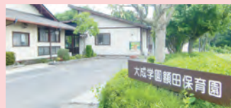
大成学園額田保育園 〒311-0107茨城県那珂市額田南郷499番地5