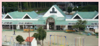
認定こども園 大成学園幼稚園 〒311-0114茨城県那珂市東木倉960番地の2