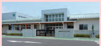
認定こども園 大成学園かさまこども園 〒309-1615茨城県空間市金井83-1