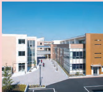
大成女子高等学校 〒310-0063茨城県水戸市五軒町3丁目2番61号