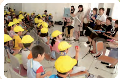
なでこホールでのコンサート