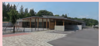
認定こども園 大成学園いなだこども園 〒309-1635茨城県空間市福田2151-1