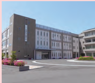
茨城女子短期大学 〒311-0114茨城県那珂市東木倉960-2

●5年一貫看護師養成課程 看護科3年と専攻科看護科2年を合わせた「5年一貫教育」により、専攻科修了と同時に「看護師国家試験」の受験資格が得られます。専攻科(2年間)で要する費用は看護大学(4年間)の約5分の1。しかも看護師国家試験合格率はほぼ100%です。