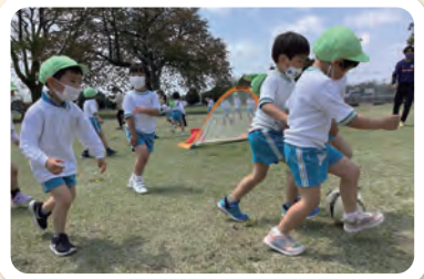
広い芝生でサッカー教室